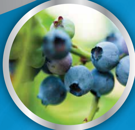
FRUITS &amp; NUTS

IDEAL FOR USE: AROUND ROSES, LISTED SHRUBS & TREES