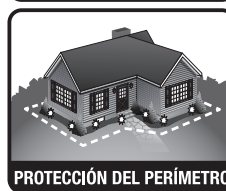
PROTECCIÓN DEL PERÍMETRO