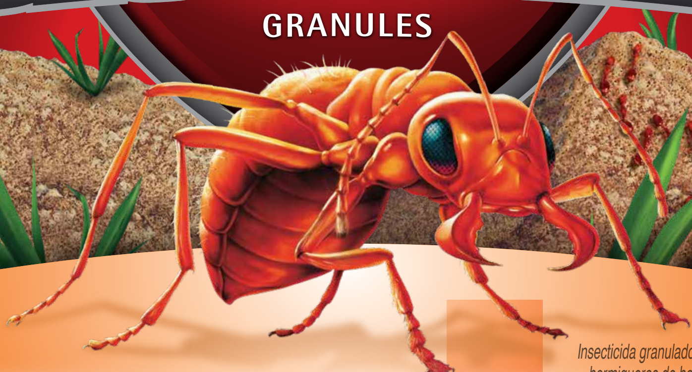
Insecticida granulado destructor de hormigueros de hormigas bravas