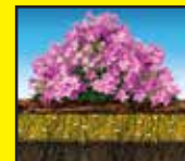
Preventing creates a barrier that stops weeds* from germinating.