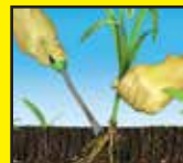
Pulling or spraying only eliminates weeds* already above ground.