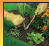
Remove Existing Weeds