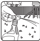
Use on lawns, landscaping and pet and backyard play areas.

NOTE: This product is non-staining to most outdoor surfaces depending on age and cleanliness. However, before using in areas where the spray may contact outdoor surfaces (vinyl siding in particular), test in an inconspicuous area and recheck in a few hours. Do not use if any staining is observed.